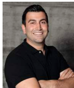
NREC NUE Mitinhaber Plattenlegermeister

UNSERE VISION - Wir schaffen Ihren Wohnraum aus einer Hand.